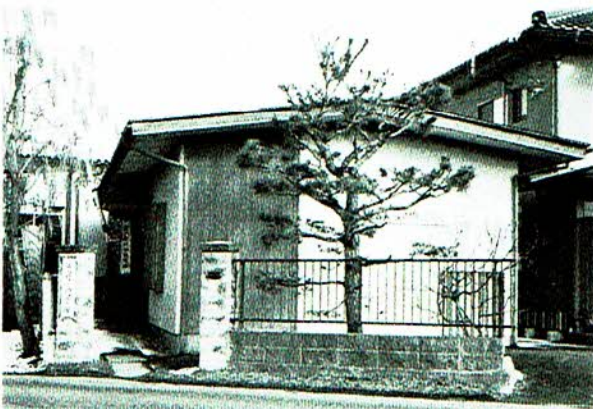
▲開館当初の記念館外観

宮入慶之助記念館活動が始まって20年が経過しようとしています。記念館だよりを基本にして、これまでの歩みを辿ってみます。記念館は、1999（平成11）年11月に開館しました。「宮入慶之