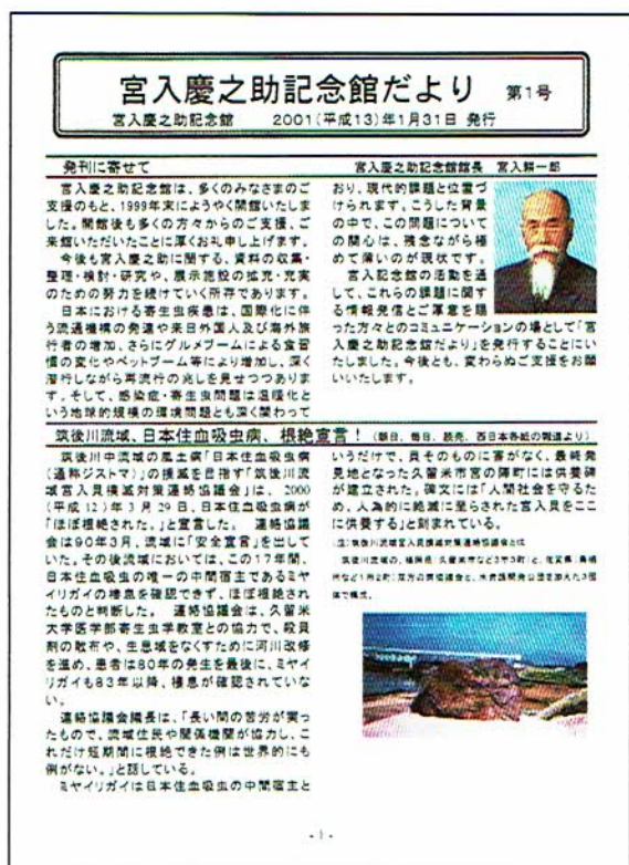
▲手づくりの「記念館だより第1号」

機関誌「宮入慶之助記念館だより」は、2001(平成13)年1月に発行開始し、ホームページ開設も2001年1月のことでした。どちらも不慣れなパソコンを使っての“手づくり”でしたが、これらは、相互の情報交換を円滑にし、活動を記録できる重要な手段となり、記念館活動を保障するものとな